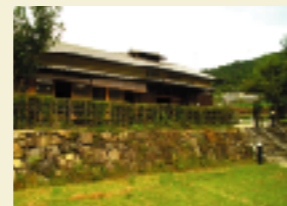
井手町まちづくりセンター椿坂【井手町】

座禅 美しい茶畑を望む禅寺で座禅を組み、姿勢・呼吸・心をととのえ、精神統一。 場所 正法寺