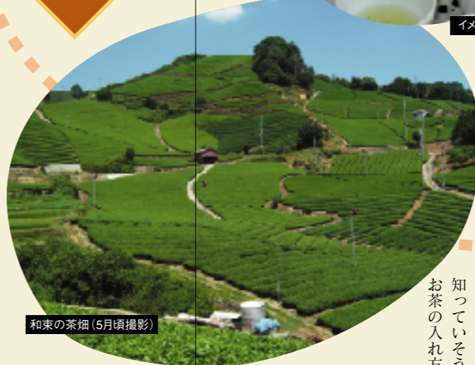
和束の茶畑(5月頃撮影)

野草ウォーキング 地元の方たちと一緒に、野草を摘み出かけます。摘んだ野草はさっそくお料理。みんなでいただきます。