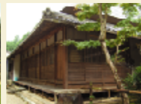
正法寺(臨済宗永源寺派 正法禅寺)【和束町】