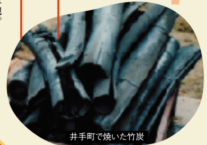
井手町で焼いた竹炭