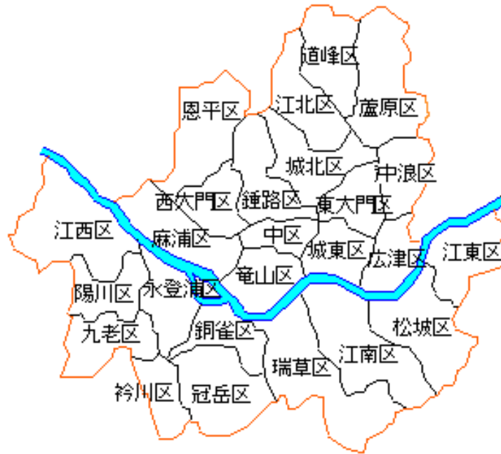
図 4.1 ソウル市の行政区の分布状況