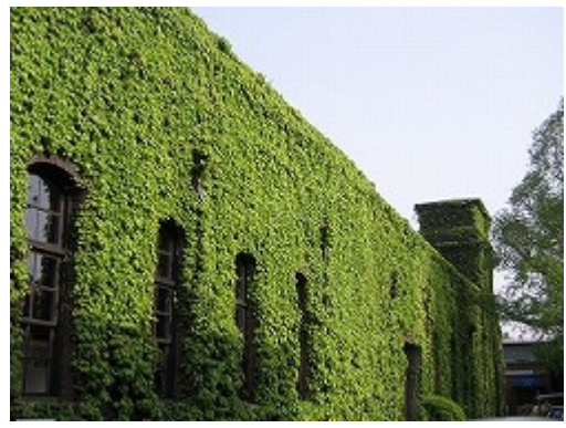
アイビースクウェア