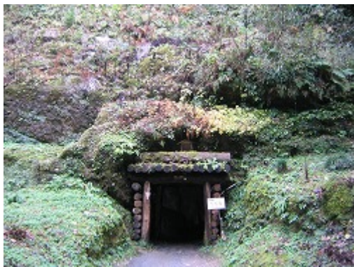
坑道への入り口（龍源寺間歩）