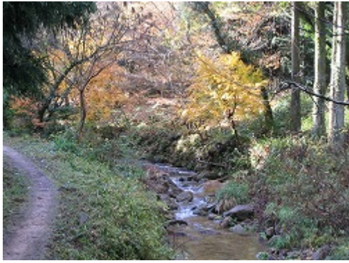
美しい自然の残る石見銀山周辺