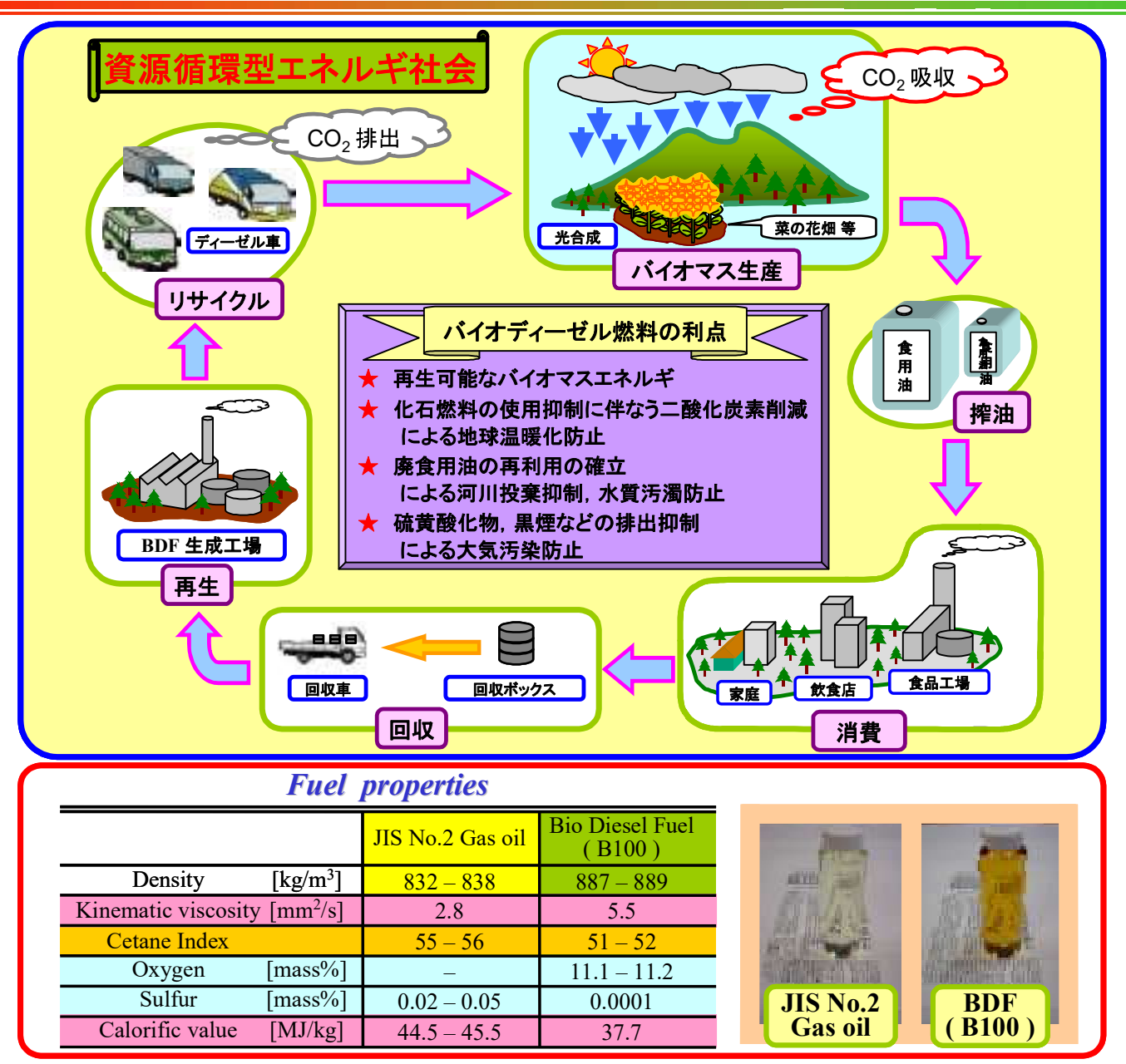
同志社大学エネルギー変換研究センター Energy Conversion Research Center - Doshisha Univ.